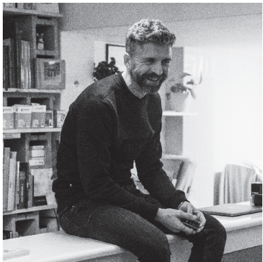
Autora: Aitana Tubio