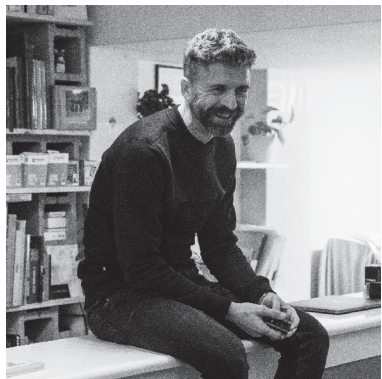
Autora: Aitana Tubio